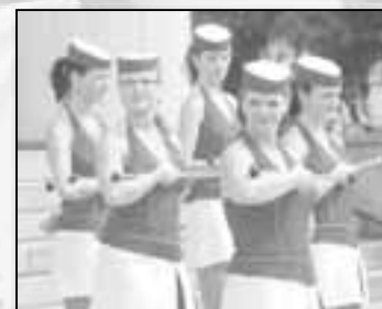
Během slavnostního zahájení hrála Koletova hornická hudba, která doprovázela skupinu mažoretke ze Rtyně v Podkrkonoší.