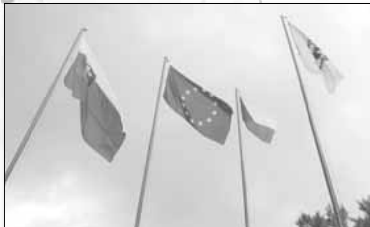
Čtyřmi hymnami (českou, evropskou, slovenskou a festivalovou) byl včera oficiálně zahájen 78. ročník Jiráskova Hronova.